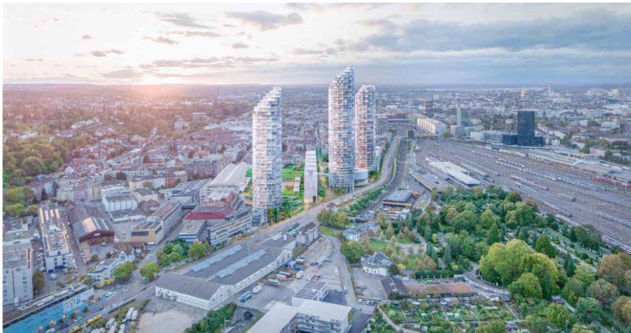
Das Dreispitzareal liegt teilweise im Kanton Basel-Landschaft und Kanton Basel-Stadt. In der Stadt werden Mehrwerte bei Um- und Aufzonungen zu 50 Prozent abgeschöpft, im Kanton Basel-Landschaft hingegen sind in diesem Bereich einzig vertragliche Lösungen möglich.

Das Fazit: Die Botschaft «Innenentwicklung vor Aussenentwicklung» ist bei den Kantonen angekommen. Leider aber planen sie noch mit zu grossen Bauzonen und ermöglichen ein Wachstum der Siedlungen auf Kosten der Fruchtfelderflächen. «Gut ist, dass der Bund seine Rolle als Oberaufsicht besser wahrnimmt und deshalb für acht Kantone einen Einzonungsstopp erlassen hat», sagte Zumbrunn.