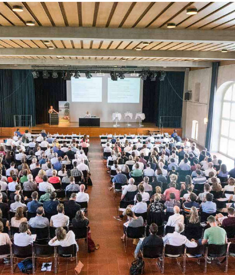
Der Jahreskongress von EspaceSuisse im Landhaus Solothurn war gut besucht...

Fünf Jahre hatten die Kantone Zeit, die Vorgaben des revidierten Raumplanungsgesetzes (RPG 1) umzusetzen. Was haben sie geschafft, was vernachlässigt? EspaceSuisse zog am Jahreskongress 2019 eine Bilanz. Sie fiel durchgezogen aus. Enttäuscht zeigte sich insbesondere alt Bundesrichter Heinz Aemisegger über die minimalistische Umsetzung des Mehrwertausgleichs und den mangelnden Kulturlandschutz in manchen Kantonen. Fachleute blicken nun mit Ehrfurcht auf die Herkulesaufgabe, vor der die Gemeinden stehen.